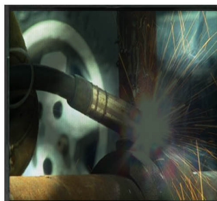
X/X/3/X Nerovnoměrné ztmavení